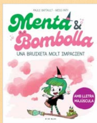
Menta i bombolla