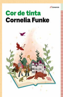
Cor de tinta