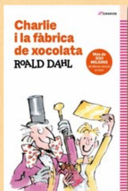
Charlie i la fàbrica de xocolata