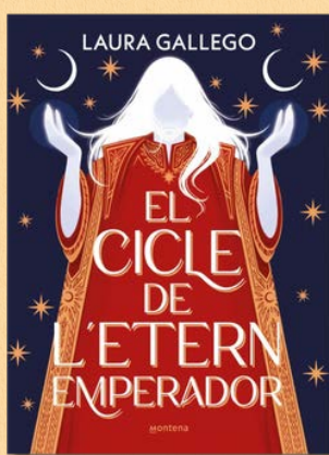
El cicle de l'etern emperador