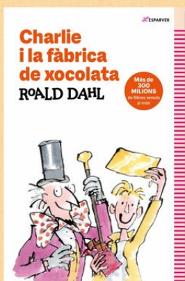
Charlie i la fàbrica de xocolata