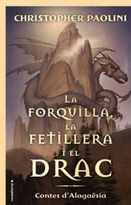
La forquilla, la fetillera i el drac