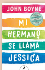
3 Mi hermana se llama Jessica, JOHN BOYNE (Salamandra bolsillo)