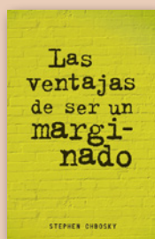
2 Las ventajas de ser un marginado, STEPHEN CHBOSKY (Alfaguara)