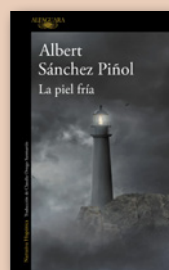
4 La piel fría, ALBERT SÁNCHEZ PIÑOL (Alfaguara)