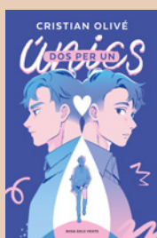
1 Dos per un , CRISTIAN OLIVÉ (Rosa dels Vents)

Aquest itinerari inclou fragments d'aquestes cinc obres: