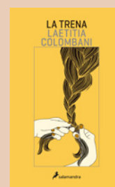
5 La trena , LAETITIA COLOMBANI (Salamandra)