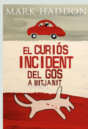
2 El curios incident del gos a mitjanit MARK HADDON (La Magrana / Debutxaca)