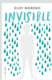
1 Invisible ELOY MORENO (Nube de Tinta)

Aquest itinerari inclou fragments d'aquestes cinc obres: