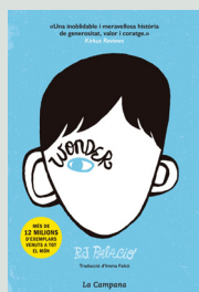
3 Wonder R. J. PALACIO (La Campana)