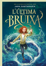
3 L'última bruixa JARA SANTAMARÍA (B de Blok)