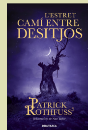
5 L'estret camí entre desitjos PATRICK ROTHFUSS (Rosa dels Vents)