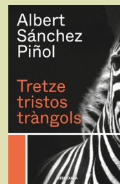
4 Tretze tristos tràngols ALBERT SÁNCHEZ PIÑOL (La Campana / Debutxaca)