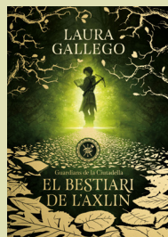
2 El bestiari de l'Axlin LAURA GALLEGO (Montena)