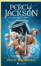
1 Percy Jackson: El lladre del llampec RICK RIORDAN (Salamandra)

Aquest itinerari inclou fragments d'aquestes cinc obres: